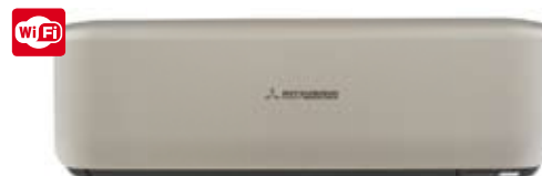
SRK 20~50 ZS-ST Titanium