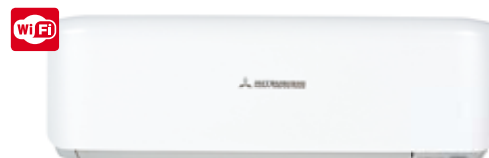
SRK 20~50 ZS-S

SRK 20 ZS-S + SRC 20 ZS-S SRK 25 ZS-S + SRC 25 ZS-S SRK 35 ZS-S + SRC 35 ZS-S SRK 50 ZS-S + SRC 50 ZS-S SRK 20 ZS-ST + SRC 20 ZS-S SRK 25 ZS-ST + SRC 25 ZS-S SRK 35 ZS-ST + SRC 35 ZS-S SRK 50 ZS-ST + SRC 50 ZS-S